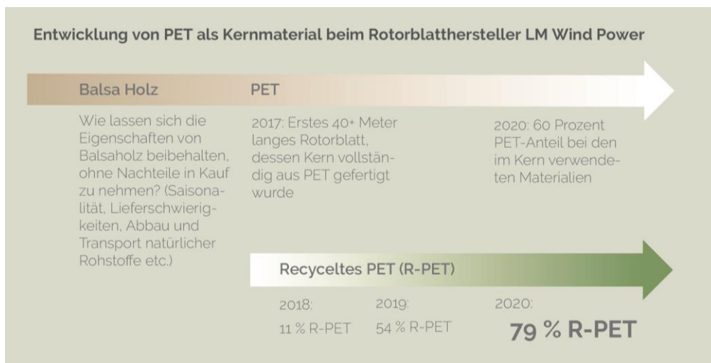
Abbildung 2: Die Steigerung des Anteils von Recyclingmaterialien in der Produktion reduziert Risiken entlang der Lieferkette und verbessert die Umweltbilanz der Produkte 6

Hinzu kommt, dass immer mehr Hersteller hierzulande dazu übergehen, Balsaholz durch spezielle Kunststoffe bzw. PET und PVC-Schaum zu ersetzen. Denn trotz all seiner Vorzüge bleibt Balsaholz ein Rohstoff, dessen Qualität, Verfügbarkeit und Preis teils starken Schwankungen unterliegen. PET- und PVC-Schaum dagegen sind problemlos verfügbar und zeichnen sich durch eine gleichbleibende Qualität aus. Laut Aussage von Branchenexpert*innen wird Balsaholz aktuell nur noch in rund 30 Prozent der Rotorblätter verwendet, Tendenz weiter fallend (siehe Abbildung 2). Es ist davon auszugehen, dass diese Kunststoffe das Balsaholz als Werkstoff in naher bis mittlerer Zukunft vollständig ersetzen werden. Denn sie können auch nach vielen Jahren noch problemlos wieder aufbereitet bzw. recycelt werden, was den ambitionierten Nachhaltigkeits- und „zero-Waste“-Zielen vieler Hersteller zugutekommt 4 . Schon seit Jahren investieren sie in Forschung und Entwicklung neuer Verfahrenstechniken, um Abfälle, die während Produktion, Betrieb und nach dem Ende der Betriebszeit von Windenergieanlagen anfallen schrittweise auf null zu reduzieren. Im Sinne einer Kreislaufwirtschaft sollen dabei alle Werkstoffe möglichst klimaneutral wiederverwendet, repariert oder recycelt werden. Schon heute sind rund 85 Prozent der Bestandteile einer Windenergieanlage problemlos recycelbar. 5