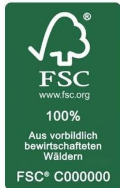
Abbildung 3: Deutsches FSC-Siegel

Auch wenn nur ein kleiner Teil der ecuadorianischen Balsaholz Exporte bei deutschen und europäischen Herstellern landet, ist es ebenso wie bei anderen Holzarten berechtigt und wichtig nach der Herkunft des Holzes sowie nach den sozialen und ökologischen Auswirkungen vor Ort zu fragen. Alle deutschen und europäischen Hersteller haben uns auf Nachfrage bestätigt, dass sie beim Einkauf von Balsaholz auf Herkunftsnachweise achten. Dabei beziehen sie es entweder direkt über dauerhafte, lokale Partnerschaften, oder aus Quellen, die von international anerkannten Institutionen für ihre Qualität und Nachhaltigkeit zertifiziert wurden und über einen Herkunftsnachweis verfügen. Eines der bekanntesten internationalen Labels stammt vom Forest Stewardship Council (FSC), dessen Verwendung auch vom ecuadorianischen Verband der Holzindustrie (AIMA) empfohlen wird. 9 Der FSC-Standard garantiert einerseits die Einhaltung einer Reihe von sozialen Vorgaben, um die wirtschaftlichen und sozialen Bedürfnisse von Waldarbeitern, lokalen Gemeinden, indigenen Bevölkerungsgruppen sowie die Einhaltung von Arbeitnehmerrechten und Arbeitsschutzvorgaben langfristig zu garantieren.